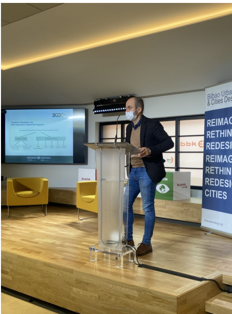
Tras Inunciaga, Asier Aranbarri, Asesor de la Secretaría General de

Transición Social y Agenda 2030 del Gobierno Vasco nos habló de cómo combatir la inequidad social en las ciudades implementando la Estrategia Basque Country 2030, el Programa Vasco de Prioridades de la Agenda Vasca 2030: proceso de construcción, adaptación y desafíos.